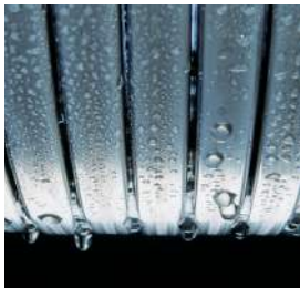
Schimbătorul de căldură Inox-Radial – durabil și eficient

Vitodens 100-W Vitodens 111-W 4,7 până la 35,0 kW