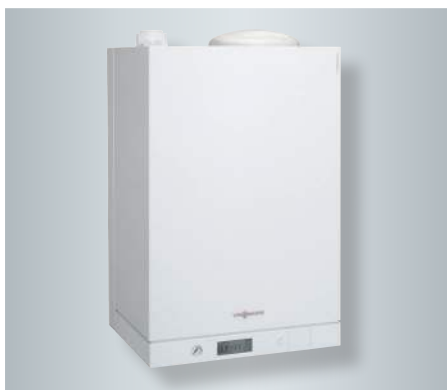
Vitodens 111-W cu acumulator a.c.m. de 46 litri