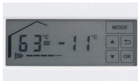
Ecran LCD touchscreen

Cazanele murale în condensatie Vitodens 100-W și Vitodens 111-W se reglează prin display-ul LCD Touchscreen. Ecranul iluminat poate fi vizualizat și utilizat cu ușurință, chiar și în împrejurimi mai întunecate.