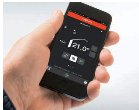
Comunicarea cu instalația termică direct de pe un dispozitiv mobil prin intermediul unei aplicații Viessmann

Cazanul compact pe lemn cu gazeificare este și un excepțional generator de energie termică pentru instalațiile de încălzire pe gaz sau combustibil lichid existente. În regim bivalent, cazanul pe combustibil solid preia sarcina încălzirii și preparării apei calde menajere. La temperaturi extrem de scăzute, se conectează și cazanul convențional pentru a prelua din sarcină de vârf.