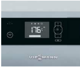
Automatizare Ecotronic 100 intuitivă, cu ecran iluminat

Vitoligno 150-S este un cazan pe lemn cu gazeificare, compact și la un preț atractiv, adecvat atât pentru o funcționare în regim monovalent cât și în regim bivalent (în completarea unei instalații termice pe gaz sau combustibil lichid).